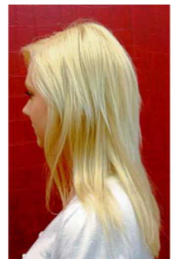
Vorher – Nachher: Mit einem schonendem Verfahren verspricht der Partner Hair-Talk langes und dichtes Haar.