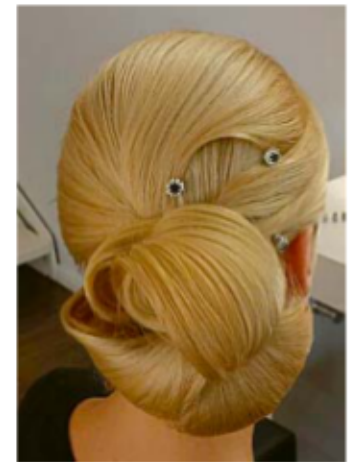
Auf das Haar hören: Das gilt auch bei Hochsteckfrisuren.